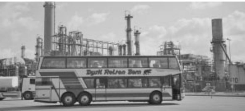
■ Die Anlagen der Erdölraffinerie Cressier und das Pferdesportzentrum Avenches. ■■