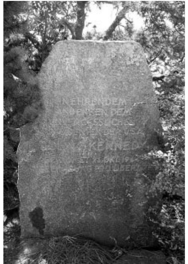
Der Kennedy-Gedenkstein auf dem Chutzen. ■■

Am 10. Dezember 1953 erhielt Winston Churchill für seine «meisterhafte Kunst historischer und biographischer Darstellung sowie für seine brillante Rhetorik im Zusammenhang mit der Verteidigung nobler menschlicher Werte» den Nobelpreis für Literatur. Angesichts seiner Leistung, der Nazi-Diktatur und später dem sowjetischen Stalinismus erfolgreich widerstanden zu haben, wäre eigentlich der Friedensnobelpreis durchaus angebracht gewesen. Churchill war wohl der letzte grosse Politiker, der alle seine öffentli-