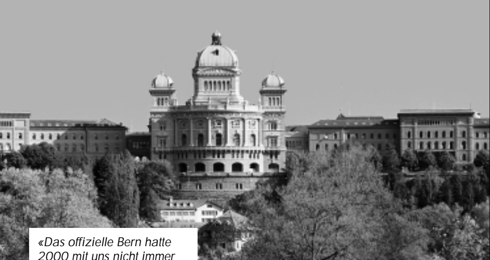
«Das offizielle Bern hatte 2000 mit uns nicht immer Freude!»

das Ziel, die Verunglimpfungsberichte der Bergier-Kommission mit geeigneten Massnahmen zu relativieren bzw. zu marginalisieren, indem die Tatsachen festgehalten werden.