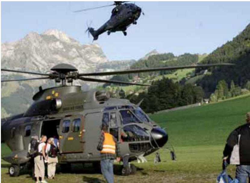
■ ■ Unwettereinsatz mit Super Pumas in Engelberg (8'600 Personen und 290 Tonnen Material). ■ ■