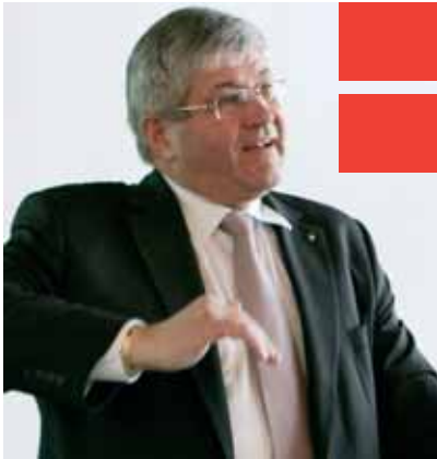
■ Nationalrat Bruno Zuppiger zu Gast bei PRO LIBERTATE. ■

hängigkeit des Landes einzusetzen zu dürfen. Das weltweite globale Theater wird immer bunter. Zuerst wurden wir ROTHäute genannt, dann auf die GRAUE Liste gesetzt und ich kann mir gut vorstellen, dass am Ende unsere Söhne auch in Afghanistan gegen radikale Islamisten kämpfen müssen, um sich PERSILWEISS zu waschen. Dagegen will ich etwas unternehmen! Ich kämpfe für die Unabhängigkeit der Schweiz und für die Freiheitsrechte der Schweizer und hoffe, dass auch Sie genau darum die Schweizerische Vereinigung PRO LIBERTATE weiterhin nach Ihren Kräften unterstützen.