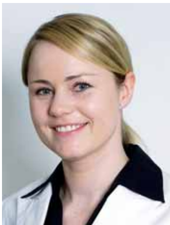
NATIONALRÄTIN NATALIE RICKLI, WINTERTHUR (ZH)

Aus dem Ausland sind wir uns Schreckensmeldungen gewohnt. Aber auch in der Schweiz häufen sich Meldungen von Gewalttaten: Ende Januar wird ein Rentner am Basler Bahnhof von einem Türken spitalreif geprügelt. Wenige Tage später wird ein friedlicher Fasnächtler von drei aggressiven Jugendlichen aus dem Balkan totgeschlagen. In Zürich und anderen Städten sind Schlägereien und Messerstechereien bis hin zur Tötung an jedem Wochenende trauriger Alltag geworden. Die meisten dieser Vergehen haben etwas gemeinsam: Fast alle Täter sind Ausländer. Zahlreiche stammen aus Balkanstaaten. Und einige hatten seit kurzer Zeit auch einen Schweizer Pass.