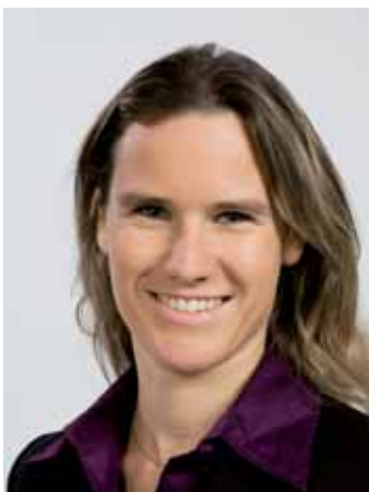
NATIONALRÄTIN ANDREA GEISSBÜHLER, SVP HERRENSCHWANDEN (BE)

Die Schweiz hat seit Jahren einen der weltweit höchsten Ausländeranteile – bei einer gleichzeitig rekordhohen Einbürgerungsrate pro Kopf. Würde man die in den letzten 25 Jahren eingebürgerten Ausländer noch dazu zählen, so käme man auf einen Anteil von etwa 30% der Gesamtbevölkerung. Mit einer weichen Einbürgerungspraxis versuchen linke Kreise, den hohen Ausländeranteil in verschiedenen Statistiken zu kaschieren. Die Folgen der immer lascheren Einbürgerungspraxis sind bereits heute sichtbar: Wir haben zunehmend mit Masseneinbürgerungen zu kämpfen. Die jährlichen Einbürgerungen haben sich von 1991 bis 2007 beinahe verachtfacht! Mittlerweile werden pro Jahr rund 50 000 Ausländer eingebürgert (dies entspricht in etwa der Einwohnerzahl der Stadt Luzern!). Das heisst 130 Einbürgerungen pro Tag! Von diesen Eingebürgerten stammt die Hälfte aus dem Balkan oder der Türkei. Lediglich ein Viertel der Eingebürgerten kam 2007 aus EU-Ländern, obwohl Italiener und Deutsche die grössten Ausländergruppen in der Schweiz ausmachen.