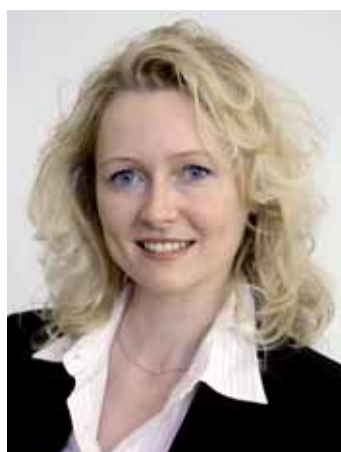
ISABELLE MORET, NATIONALRÄTIN UND VIZEPRÄSIDENTIN DER FDP SCHWEIZ, LAUSANNE

Der Verfassungsartikel zur Gesundheit zielt auf die Förderung der Qualität in der Gesundheitsversorgung ab. Dieses Ziel soll durch die Schaffung von zwei Grundvoraussetzungen er-