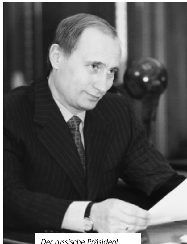
Der russische Präsident Putin: Russland will Weltmacht sein, militärisch und wirtschaftlich. Spionage ist dazu ein Mittel

Das Vorgehen, einen Mitteleuropäer für die Spionage Moskaus zu gewinnen, ist dabei auf allen russischen Botschaften das gleiche: Will man mit einer Person in Kontakt treten, werden zunächst seine Gewohnheiten, seine Hobbies und gerade auch seine Schwächen ausgekundschaftet. Das direkte Ansprechen erfolgt scheinbar zufällig, das kann auf einem Botschaftsempfang sein, bei einem Konzert, im Theater – überall. Wichtig für den «Diplomaten» ist, auch auf privater Ebene möglichst bald ein Vertrauensverhältnis zu dem Spion in spe aufzubauen: Ziel ist es, bei diesem Hemmschwellen abzubauen, um von ihm nicht nur offene Nachrichten, sondern mit der Zeit auch vertrauliche und geheime Informationen zu erhalten. Fanden die Begegnungen beiderseits mit Ehefrauen und Kindern statt, so erfolgt nach gewisser Zeit ein Abkoppeln von diesen; der Russe behauptet dazu allgemein, man wolle lieber «von Mann zu Mann reden». Die nächste Stufe geht dann schon ins Konspirative, was eigentlich jeden Schweizer misstrauisch machen sollte: Eines Tages nämlich bittet dann der Russe, ihn nicht mehr in der Botschaft anzurufen –, die Verbindung vertraulich zu behandeln und gegenseitig geheime «Treffe» zu vereinbaren. Geld- und Sachgeschenke verstricken die Person mehr und mehr in ein (natür-