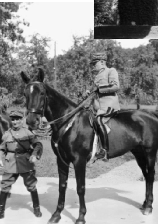
General-Guisan-Zyklus 2000: Schloss Jegenstorf im Kanton Bern, 1944–45: Standort des persönlichen Stabes des Generals